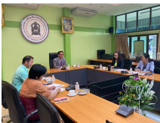
ภาพ ๑ การประชุมวางแผนงาน/โครงการ

๑๖. ภาพกิจกรรมที่เกิดขึ้นภายในโครงการ / กิจกรรม (ที่สื่อถึงการดำเนินการสู่ความสำเร็จ จำนวน ๕ ภาพ ขนาด file เท่ากับหรือมากกว่า ๒ MB)