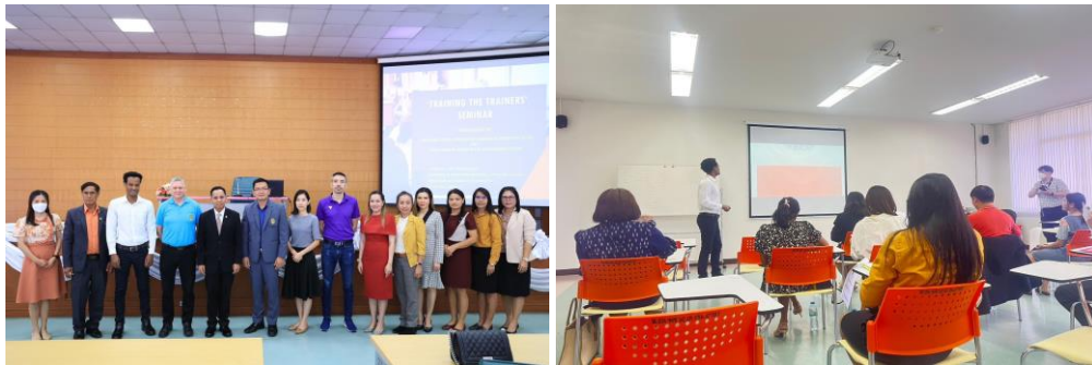
ภาพ ๘-๙ การอบรมครูแกนนำภาษาอังกฤษ ของกศจ.เพชรบูรณ์ ณ มหาวิทยาลัยราชภัฏเพชรบูรณ์