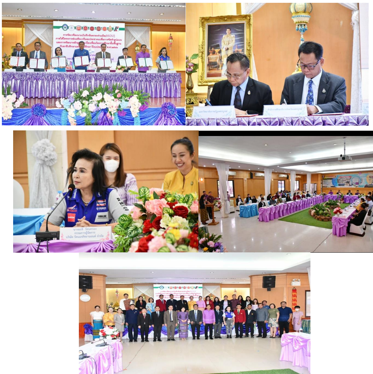
ภาพ ๑-๕ การบันทึกลงนามความร่วมมือ MOU ที่วิทยาลัยเทคนิคเพชรบูรณ์ วันที่ ๓ มีนาคม ๒๕๖๖

๑๖. ภาพกิจกรรมที่เกิดขึ้นภายในโครงการ / กิจกรรม (ที่สื่อถึงการดำเนินการสู่ความสำเร็จ จำนวน ๕ ภาพ)