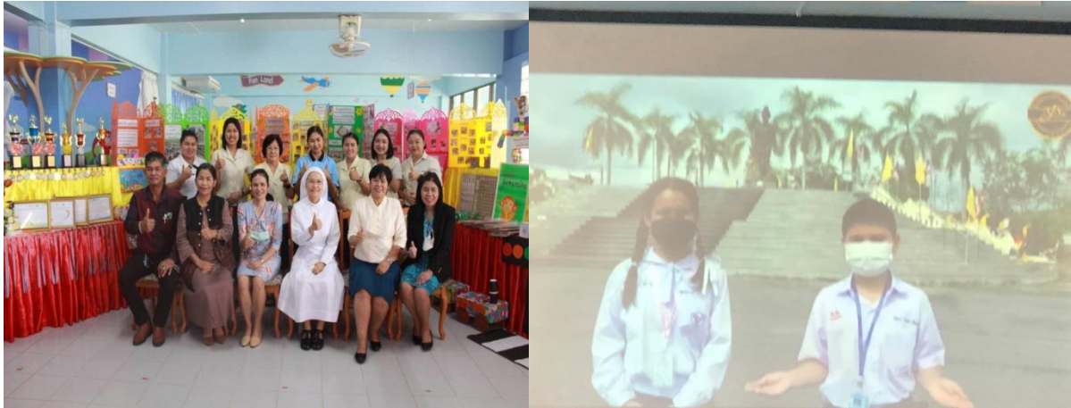
ภาพ ๖-๗ การนิเทศ กำกับติดตามกิจกรรมการเสริมสร้างคุณลักษณะลูกพ่อขุนฯ รร.เซนต์โยเซฟศรีเพชรบูรณ์