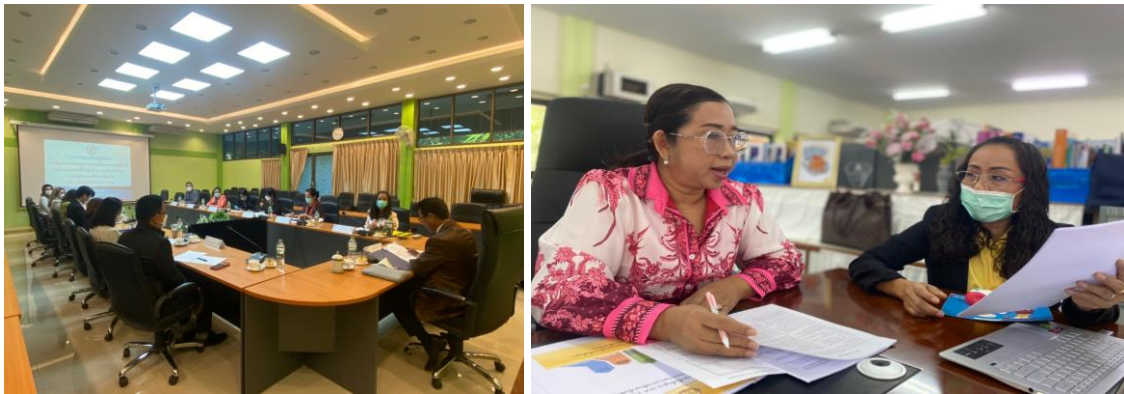
ภาพ ๔-๕ ประชุมจัดทำร่างกรอบการพัฒนาทักษะภาษาอังกฤษ