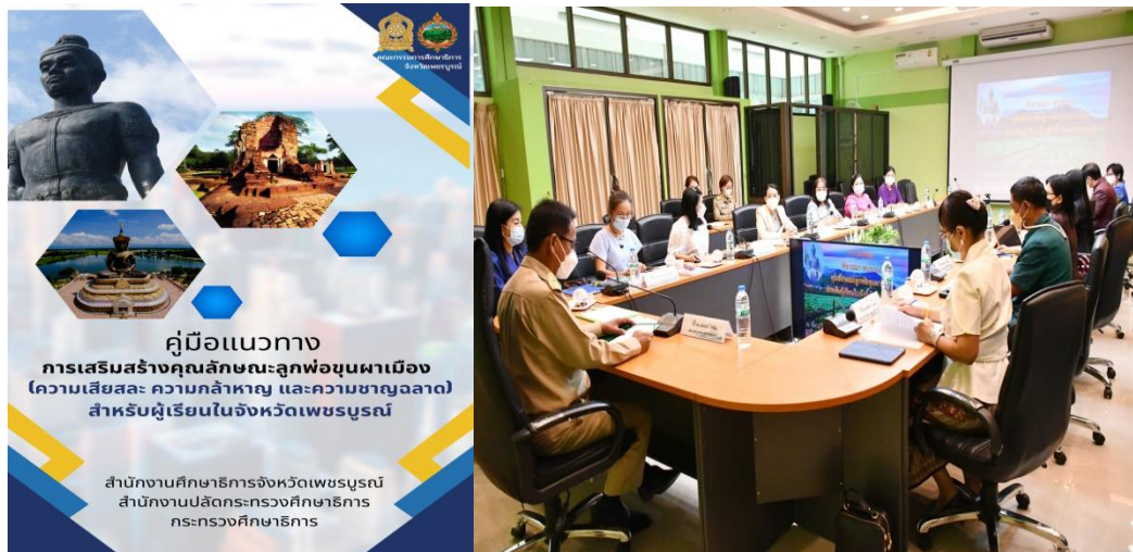
ภาพ ๒-๓ ประชุมพิจารณาบททวน ตัวชี้วัด และพฤติกรรมบ่งชี้คุณลักษณะลูกพ่อขุนฯ